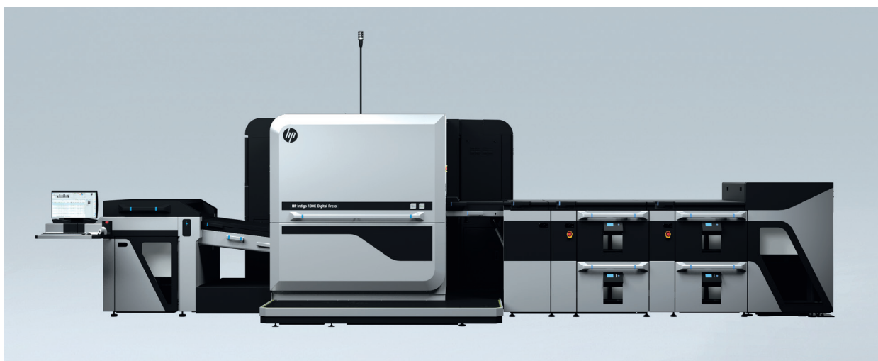
HP Indigo 100k - la nouvelle machine sera mise en service début août 2021.